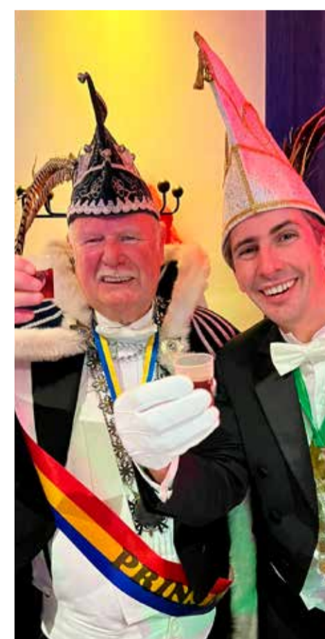
Prins Renaldo en Prins Jan de 3e van Kruikenstad.

de feestvreugde. Schoenlapperslaand kan weer terug kijken op een geslaagd evenement.