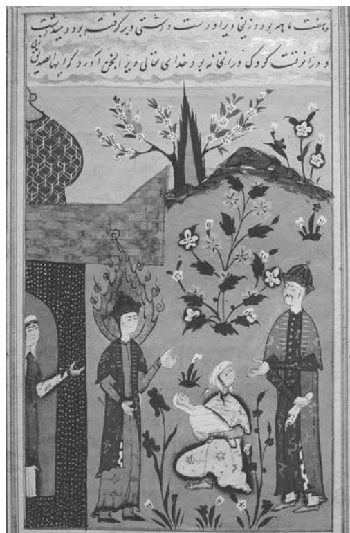
Islamische Miniatur aus der Türkei (Ende 16.Jh): Szene aus der Kindheit des Isa ibn Maryam –