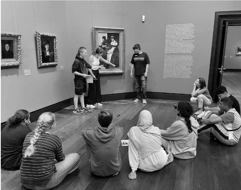
Die Jugendlichen stellen sich gegenseitig die Ergebnisse ihrer (Kleingruppen-)Gespräche vor.