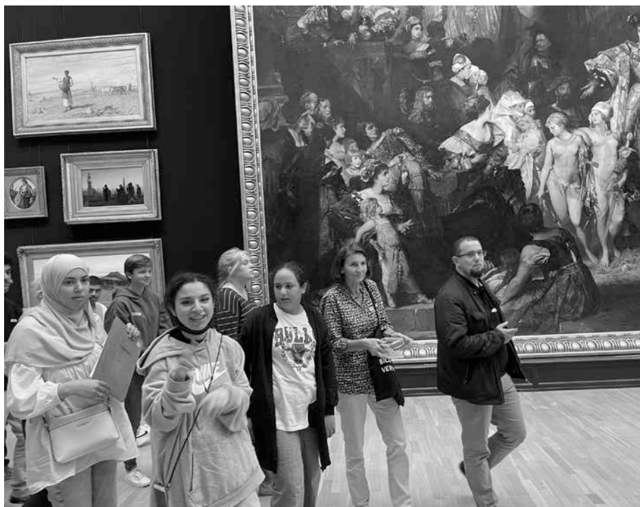
Die Jugendlichen nach einem langen Vormittag im Museum auf dem Weg in die Moschee zum Mittagessen.