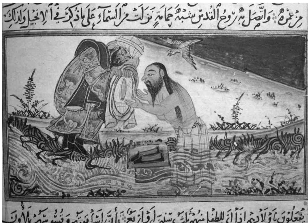
Persische Miniatur aus dem 14. Jh: Taufe des Isa ibn Maryam