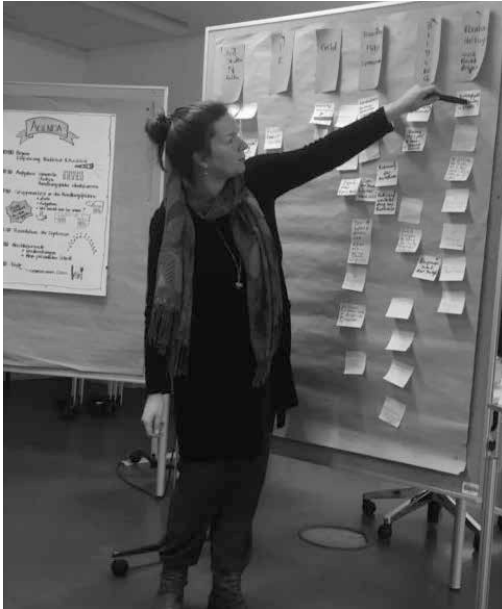
Die Organisationsmanagerin während der Beratung bei der Schura Hamburg

nikationswege in die Hamburger Behörden und Gremien hinein, sondern schafft auch der Hamburger Politik und Verwaltung einen direkten Draht zu muslimischen Akteur:innen. Damit werden beide einander zu selbstverständlichen und verlässlichen Ansprechpartnern, die sich regelmäßig an einem Tisch treffen und tragfähige Lösungen erarbeiten.