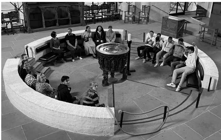
Die Auswertung des Gesehenen und Besprochenen mit den Jugendlichen aus dem Lübecker Dom und der Hamburger Moschee – rund ums Taufbecken im Lübecker Dom.

s.lorberg-fehring@nordkirche-weltweit.de