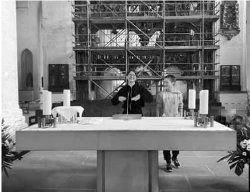
Die christlichen Jugendlichen erklären den Ablauf eines Gottesdienstes im Dom.