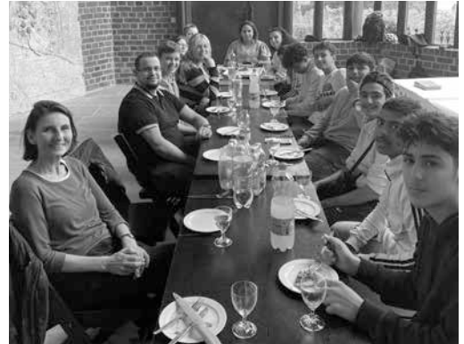
Die Jugendlichen beim gemeinsamen Pizzaeessen im Südanbau im Dom zu Lübeck.

bel ist dadurch oft missverständlich, vor allem was den unterschiedlichen historisch-kritischen Umgang angeht und die Frage, ob das, was in Koran und Bibel steht, als historische Wahrheit oder theologische Deutung zu verstehen ist. Der lebendige und gleichzeitig sehr persönliche Austausch über diese Frage führte dazu, dass die Jugendlichen einerseits eine differenzierte Wahrnehmung für die jeweils andere religiöse Tradition gewinnen konnten. Gleichzeitig war es ihnen möglich, miteinander zu teilen, was Glaube für sie persönlich bedeutet und warum er ihnen wichtig ist. Dabei konnten in der geschützten Atmosphäre der vertrauten Gruppe auch schwierige theologische Fragen zu Frage kommen.